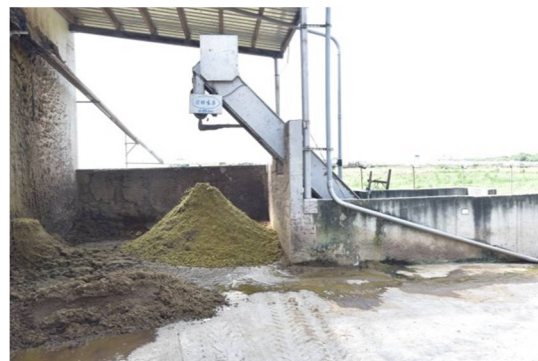
固體廢棄物再經過擠壓，降低含水量，收集經過發酵後可當有機肥料使用