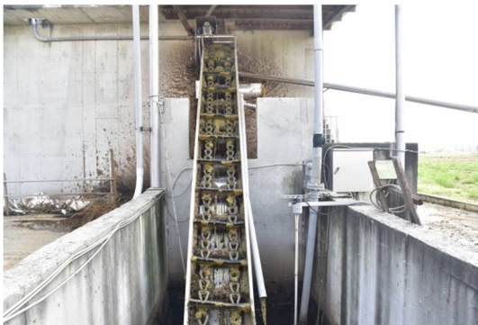
糞溝流入固液分離池後，再由固液分離機將廢水與固體廢棄物分開