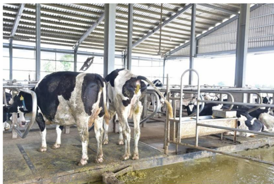
從牛床起立後舉尾大便在床下之牛道，再以自動刮糞機刮走。