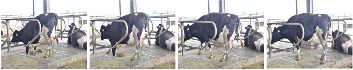
乳牛從舒適的牛床上起立的連續圖(從左至右)