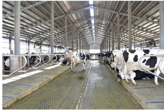
32 公尺寬的牛舍、屋頂開口 60 公分無蓋通風口、1/3 屋頂斜率。中央牛床之牛道、兩側餵飼走道。