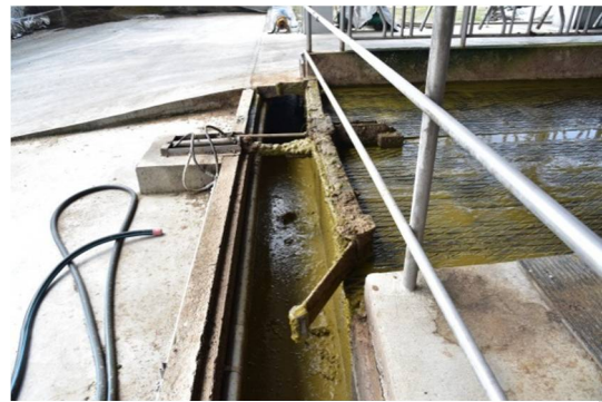
將糞尿都刮入糞溝，利用回收的糞水回沖糞溝